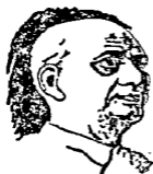
सरदार बल्लभभाई पटेल

सरदार कांग्रेस-आन्दोलन में शामिल होने से पहले ही, स्वभाव से, भारतीयता के पक्षपाती थे। महगदाबाद नगरपालिका के अध्यक्ष के रूप में और अन्य सार्व-